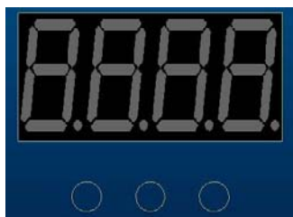
MENU DOWN UP

This product has an internal control system and interface. The system is configured and navigated via the menu, down and up buttons shown in the picture below.