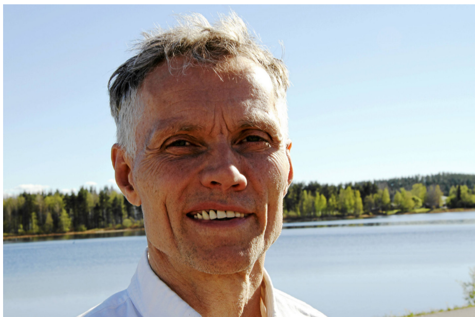
Kent Billebro har många planer gällande Ramsjö camping och Folkets hus.

Dan och Iwona Jönsson har renoverat och drivit camping och Folkets hus sedan 2010. Men när orken började ta slut bestämde de sig för att sälja.